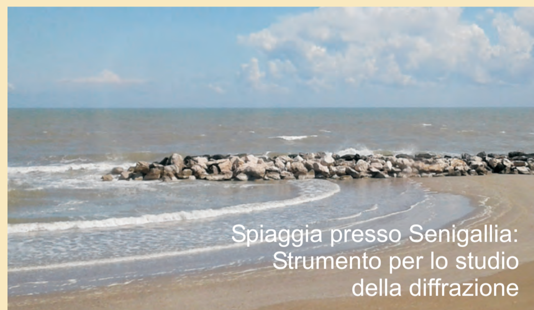
Spiaggia presso Senigallia: Strumento per lo studio della diffrazione

Prova nazionale sperimentale: Tutto fa laboratorio